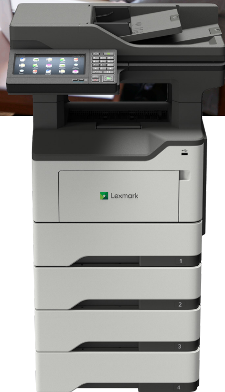
MX622adhe con bandejas opcionales

Confiabilidad. Seguridad. Productividad.